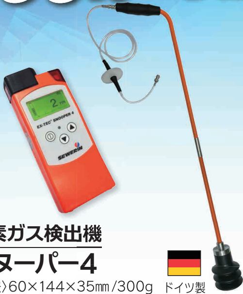
水素ガス検出機 スヌーパー4